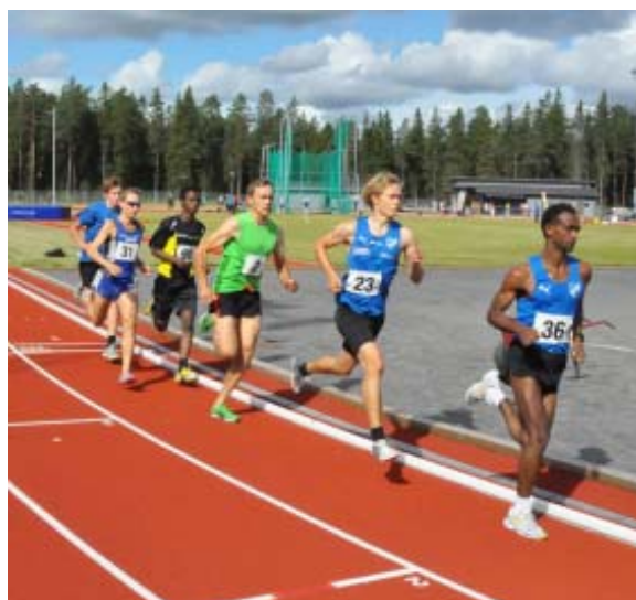
5000 m vid NLM på Campusarenan i Umeå 2011.