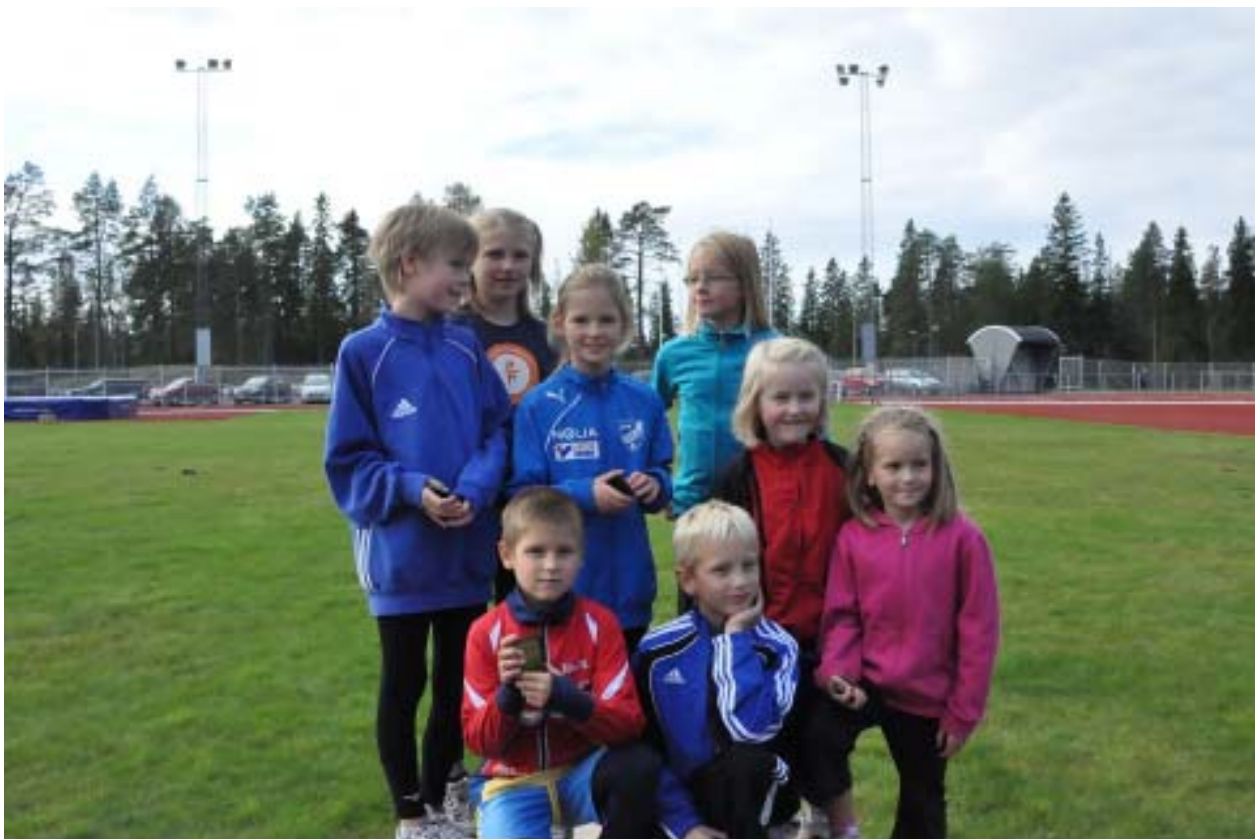
Vid Umeå Öppna kommunmästerskap varje höst deltar alltid många ungdomar.