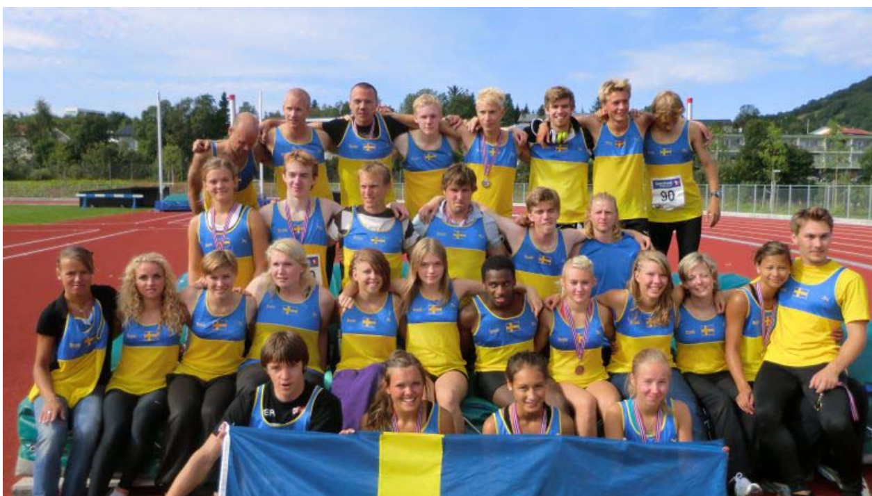
Det vinnande svenska laget vid Barentskampen i Harstad, Norge 2011.

Idrottens Hus, Järvedsleden 2, 891 60 Örnsköldsvik Pg 28 55 56-7, 0611-100 82 lthunman@hotmail.com www.afif.se