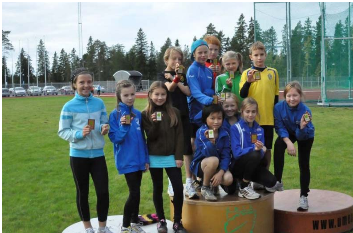
Umeå Öppna på Campusarenan i Umeå den 17 september 2011

Varje aktiv får starta i max 3 grenar plus stafett. Sista anmälningsdag fastställs av arrangören, den skall dock inte läggas tidigare än 14 dagar före tävlingen.