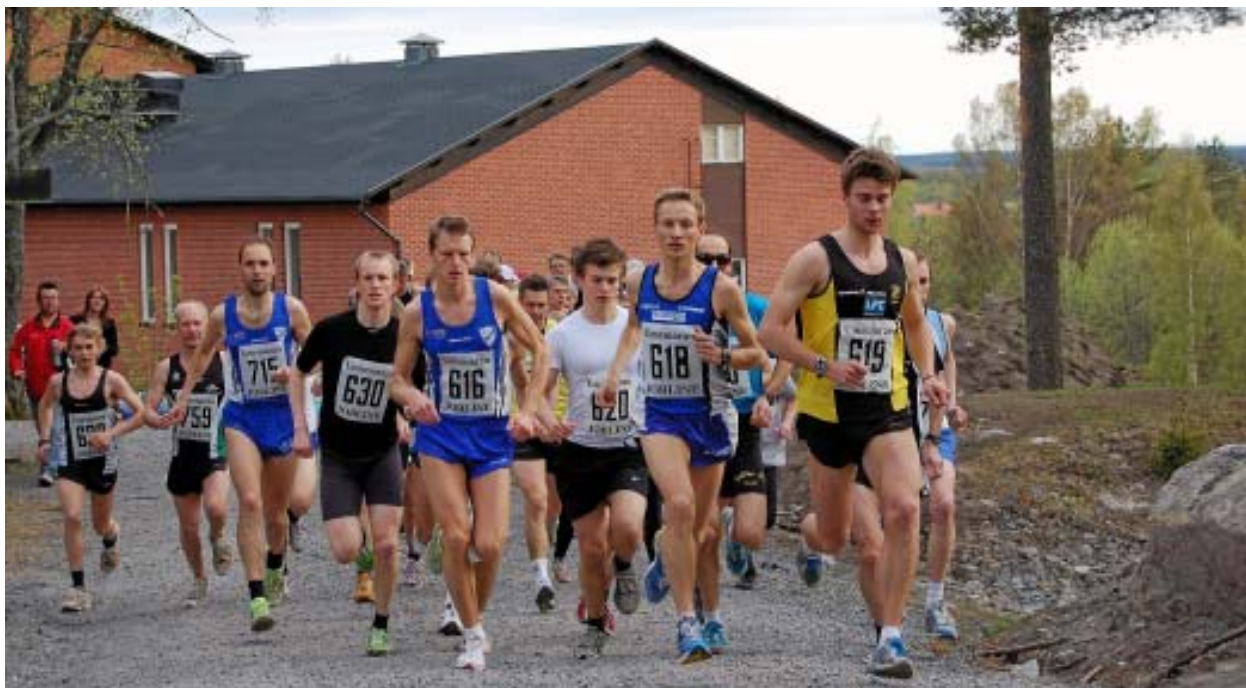
Starten vid Gammliaterrängen maj 2007