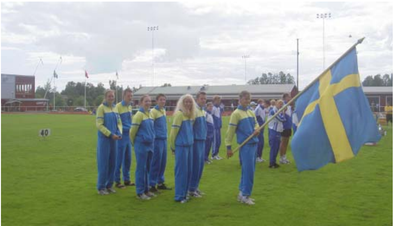
Sverige vid invigningen av Barentskampen i Piteå 2004.