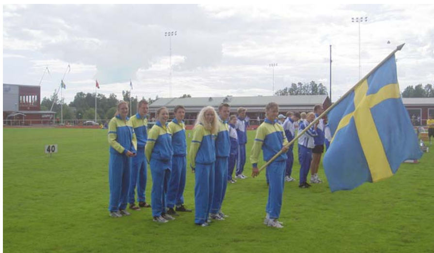
Sverige vid invigningen av Barentskampen i Piteå 2004.