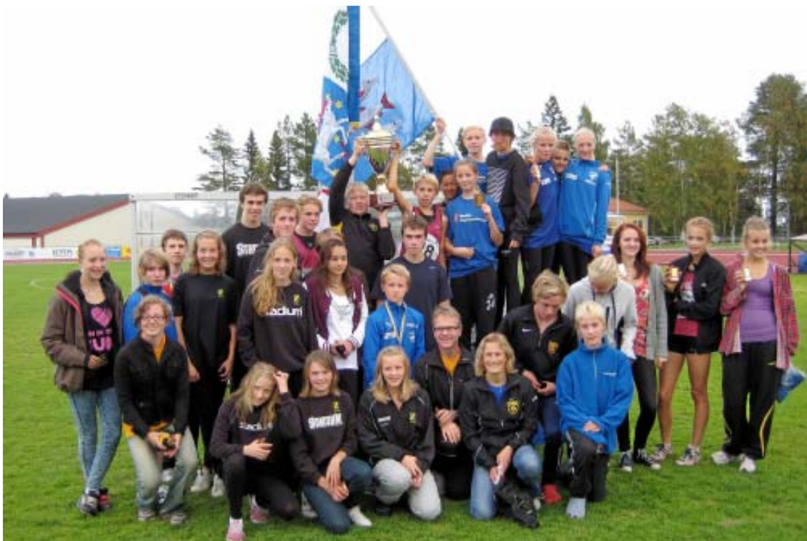
Västerbottens segrande lag vid Nordea Regionsmästerskap i Sundsvall den 11-12 september.