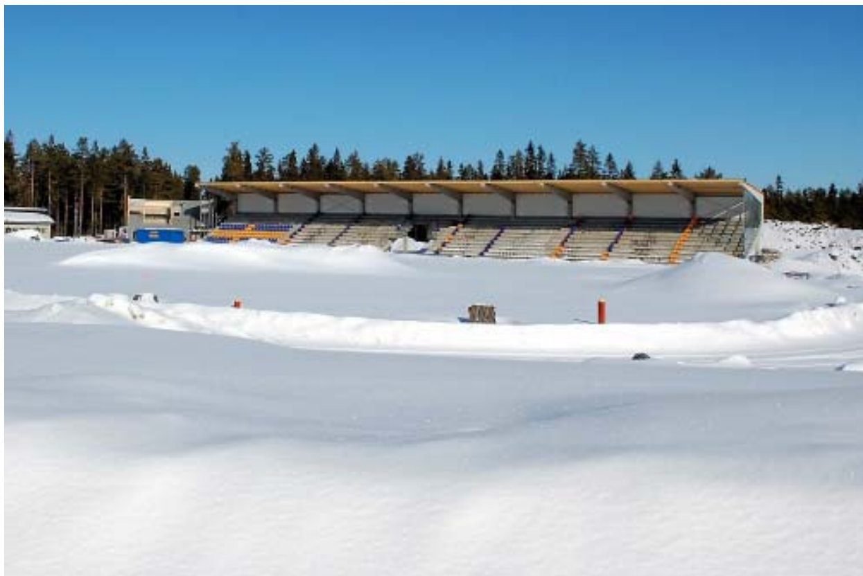
Byggandet av Campus Arena pågick mitt i smällkalla vintern.